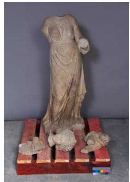
Скульптура «Осень». ГМЗ «Павловск» (до и после реставрации). ООО «РМ «Наследие»

Благодаря профессионализму коллектива ООО «ИНТАРСИЯ» Тверская областная картинная галерея, которая сегодня располагается в императорском дворце, получила возможность значительно шире задействовать существующую музейную