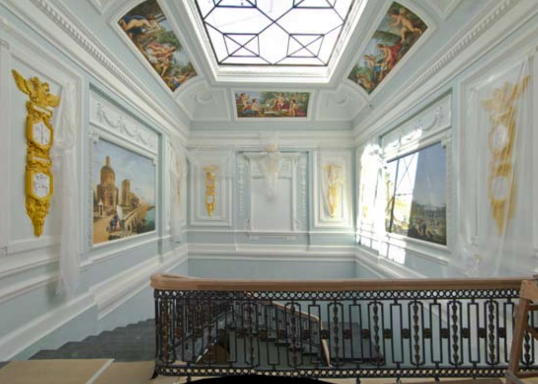
Парадная лестница Тверского императорского дворца (архивное фото и вид после реставрации). ООО «ИНТАРСИЯ»

коллекцию и представить посетителям гораздо большее количество экспонатов, чем прежде.