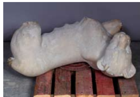
Статуя «Львица». ГМЗ «Павловск» (архивное фото, вид до и после реставрации). ООО «Наследие»