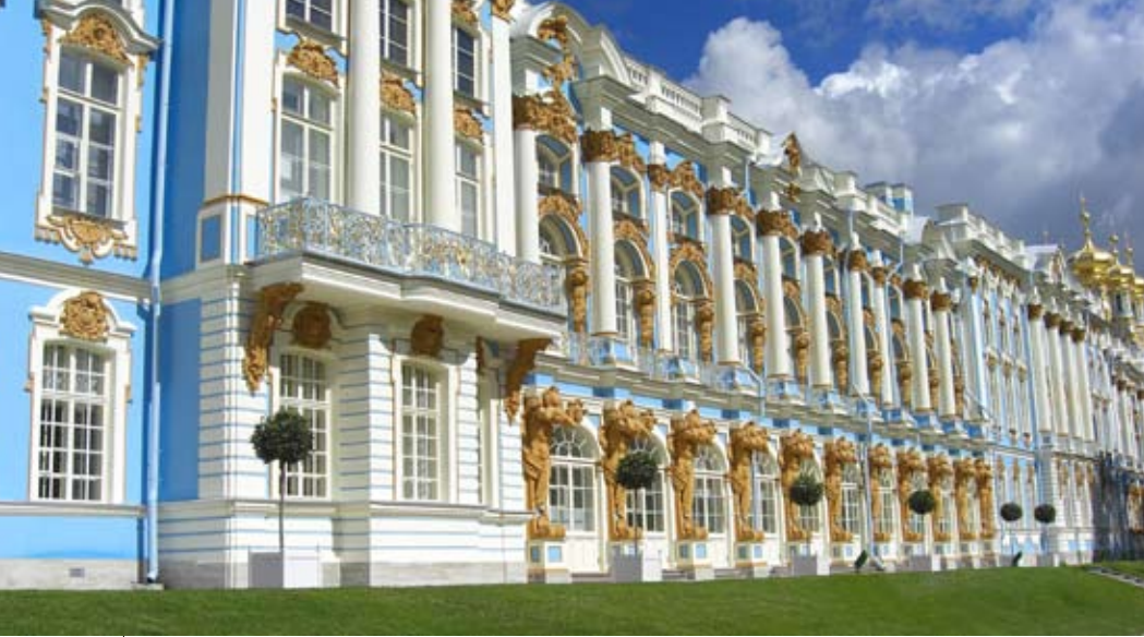
Реставрация фасадов Екатерининского дворца, Инженерного замка, Российского этнографического музея. ЗАО «Ремстройфасада»