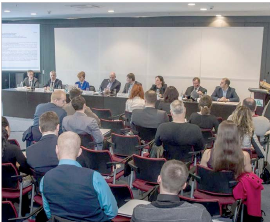
Слушатели круглого стола

Участники круглого стола отметили высокую информативность докладов и выразили надежду, что рекомендации профессионального сообщества будут услышаны законодателями.