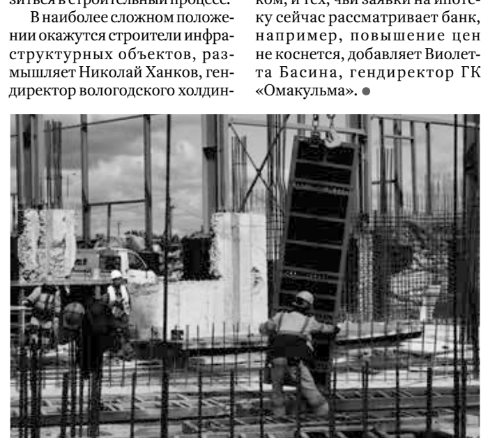
Стоимость арматуры в цене квадратного метра достигает десяти процентов.